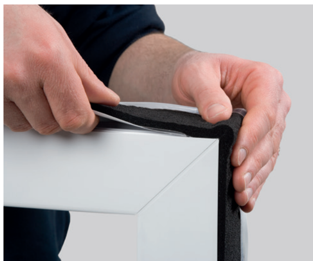
Exemple de mise en œuvre : ISO-BLOCO ONE