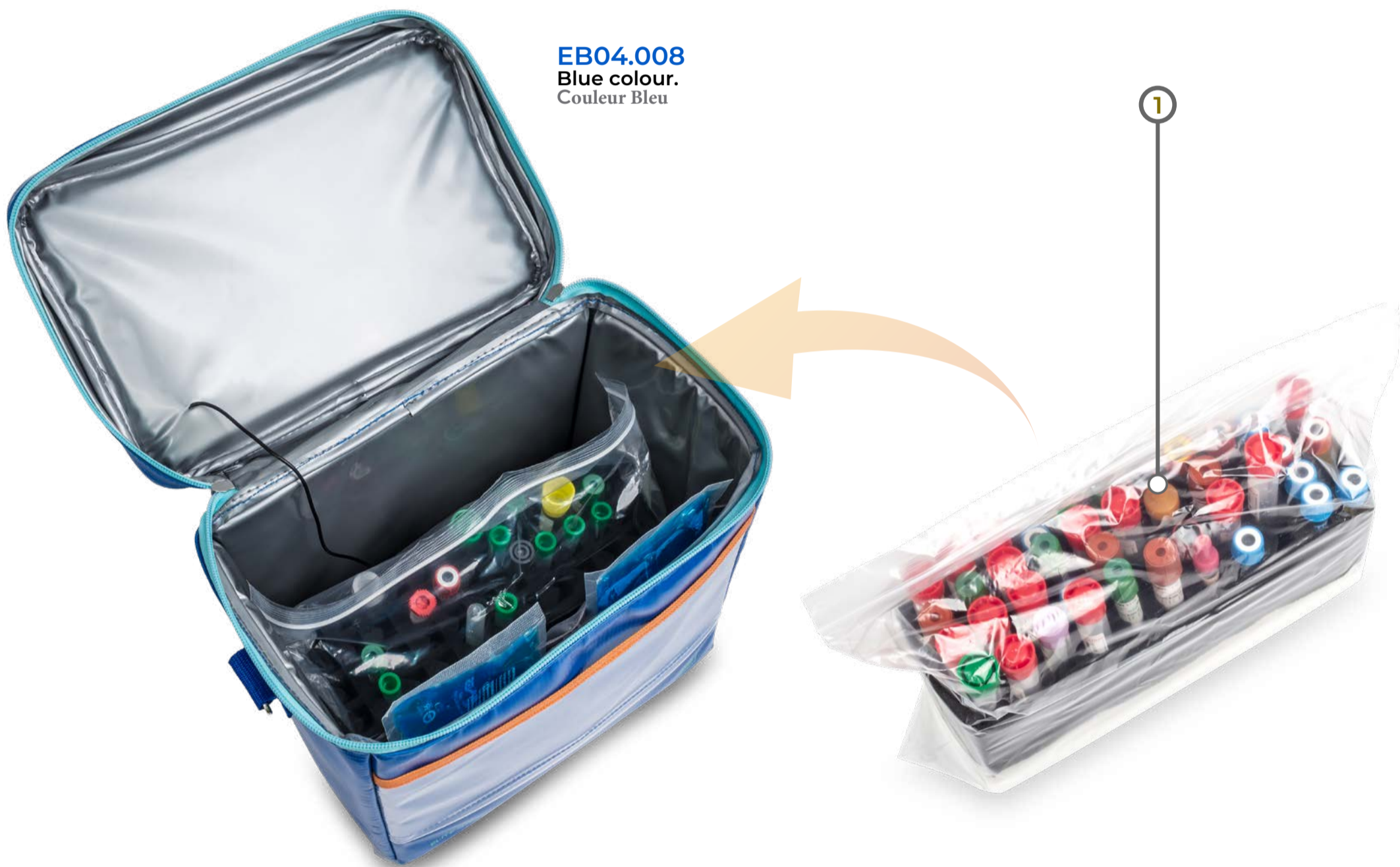
EB04.008 Blue colour. Couleur Bleu