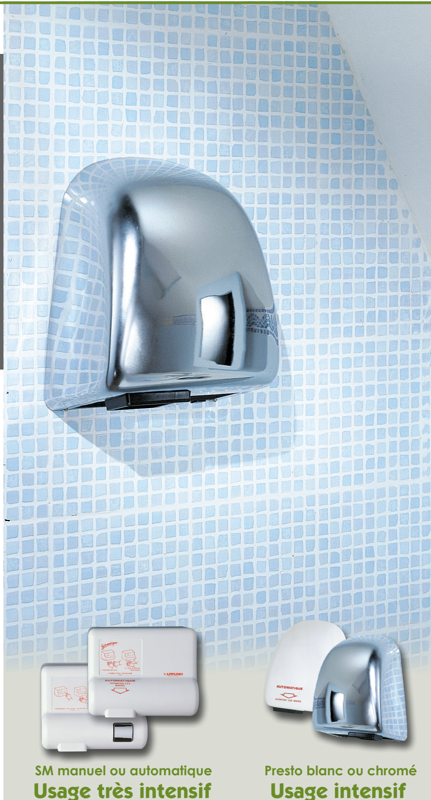
SM manuel ou automatique Usage très intensif